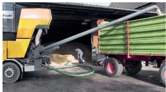
TOURMIX при непрерывном дроблении

При этом отгрузка при помощи поворотного шнека позволяет производить практически беспыльную отгрузку.