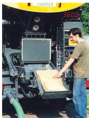
Воронка для загрузки компонентов с устройством для вскрывания мешков