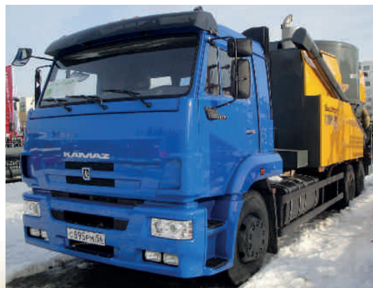
TOURMIX 02 на шасси автомобиля КАМАЗ