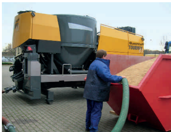
TOURMIX 02 в стационарном исполнении

На установке работает автоматическая аспирация по отделению муки, не требующая особого теххода.